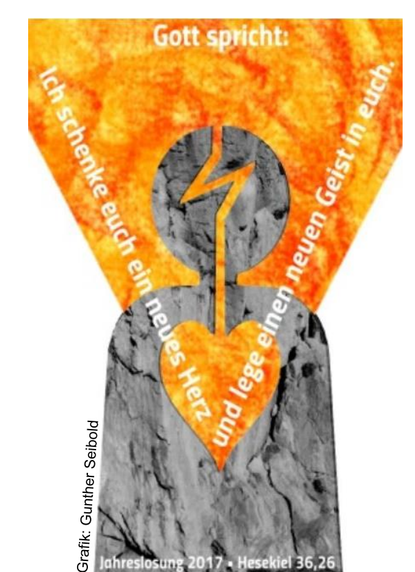
Grafik: Gunther Seibold