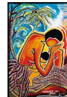
Motiv gemalt von Juliette Pita

Wie der Weltgebetstag dieses Jahr gefeiert werden kann, ist noch sehr ungewiss. Näheres ist dem Schaukasten und der Presse zu entnehmen.